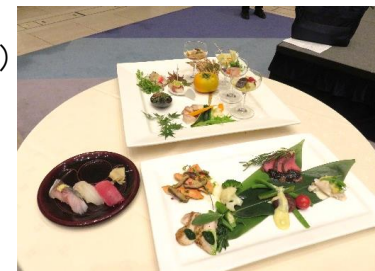
大会関連イベントで提供した被災地産食材を活用した料理