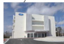
大熊分析・研究センター