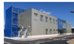
廃炉国際共同研究センター