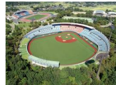
福島県営あづま球場(福島県)