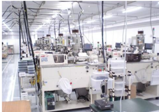
企業立地補助金を活用した電子部品製造ライン(岩手県宮古市)