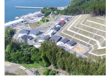
宮城県石巻市の高台移転 (荻浜地区)