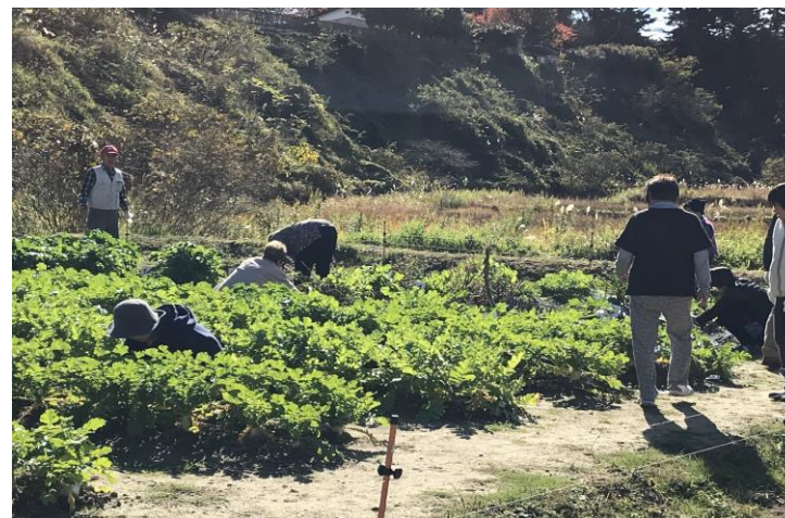
野菜作りを通じた生きがいつくり、交流づくり