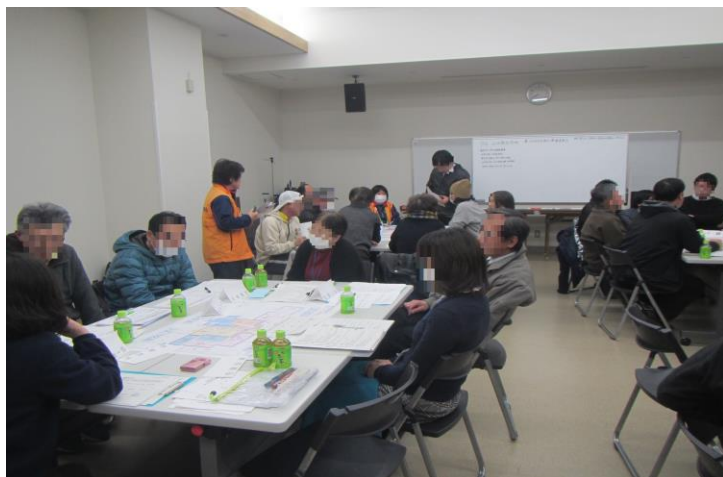
新たな高台団地でのコミュニティ形成支援 （自治会の設立準備）