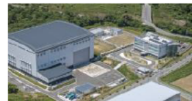
楢葉遠隔技術開発センター