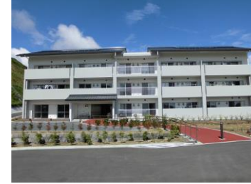
岩手県陸前高田市の災害公営住宅 (長部地区)