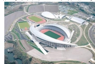
宮城スタジアム(宮城県)