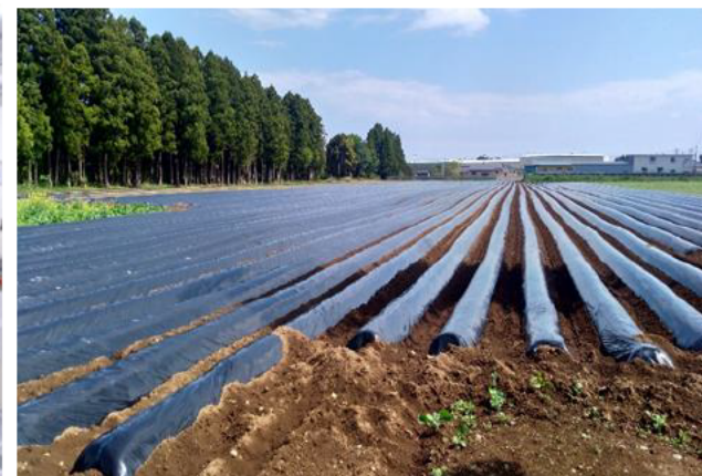
営農再開されたさつまいもの大規模農地(福島県楡葉町)