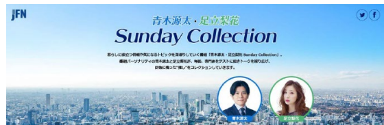
「福島の復興へ向けて 正しく知ろう廃炉とALPS処理水」 (経済産業省) (令和4年10月)