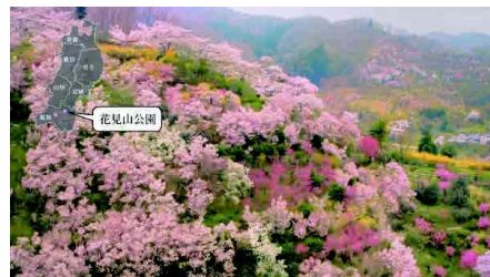
「東北の観光」(復興庁) (平成31年3月)