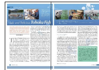
「安全で美味しい東北の魚」(農林水産省) (令和元年10月)